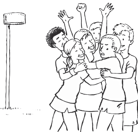
Afbeelding 1. Bij een groepshug na een gescoord punt raakt één van de spelers de borst van een medespeler aan. Zij vindt deze aanraking vervelend. 8

schrijding in de context van sport ervaart . Blijkbaar wordt er (veel) meer ervaren dan gemeld. De gevolgen hiervan zijn niet onderzocht, maar ze laten zich gemakkelijk raden: minder plezier in sport, sportuitval en – in een onbekend aantal gevallen – gekwetste en beschadigde (jonge) mensen, mogelijk voor de rest van hun leven. Reden genoeg om seksueel gedrag en seksuele integriteit in het kader van sport nader te bekijken. Overal waar in dit artikel ‘trainer’ staat, kan daarbij ook ‘coach’, ‘docent lichamelijke opvoeding’, ‘sportmasseur’, ‘sportfysiotherapeut’ etc. gelezen worden.