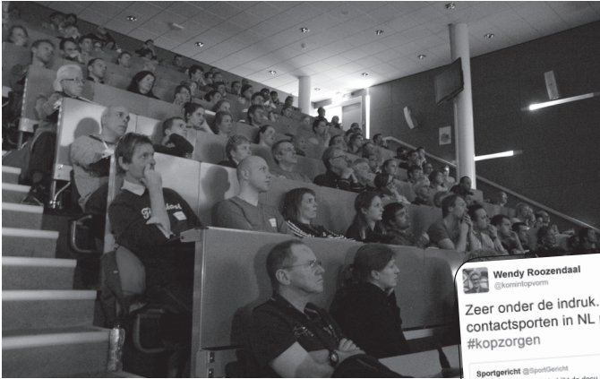
De collegezaal zat letterlijk tot de nok toe vol.